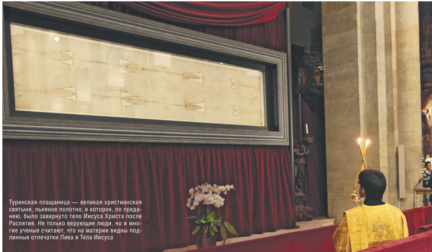
Туринская плащаница — великая христианская святыня, льняное полотно, в которое, по преданию, было завернуто тело Иисуса Христа после Распятия. Не только верующие люди, но и многие ученые считают, что на материи видны подлинные отпечатки Лица и Тела Иисуса

Тексты тогда копировались от руки во множестве экземпляров и быстро распространялись по всему цивилизованному миру. Если бы кто-то начал вносить правки в своем городе, области или даже стране, первоначальные тексты все равно бы сохранились где-то еще. Но нигде расхождений в евангельских списках не обнаружено.