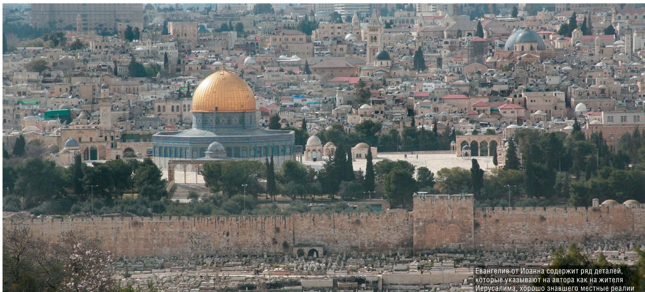
Евангелие от Иоанна содержит ряд деталей, которые указывают на автора как на жителя Иерусалима, хорошо знавшего местные реалии